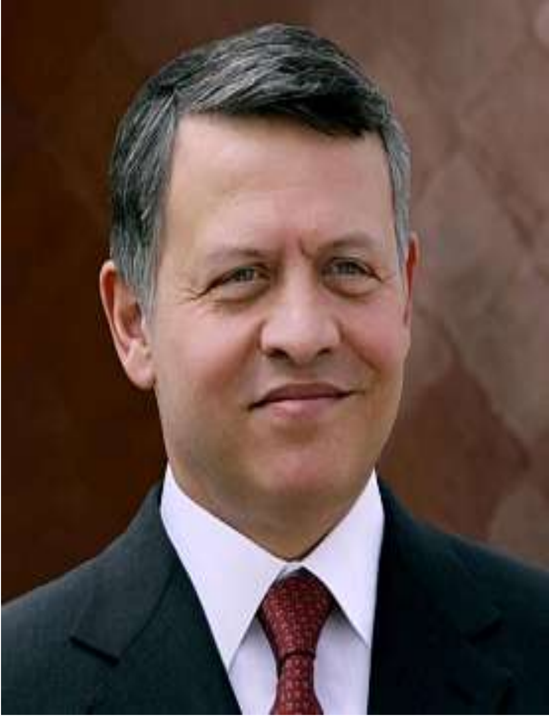
حضرة صاحب الجلالة الهاشمية الملك عبدالله الثاني ابن الحسين المعظم