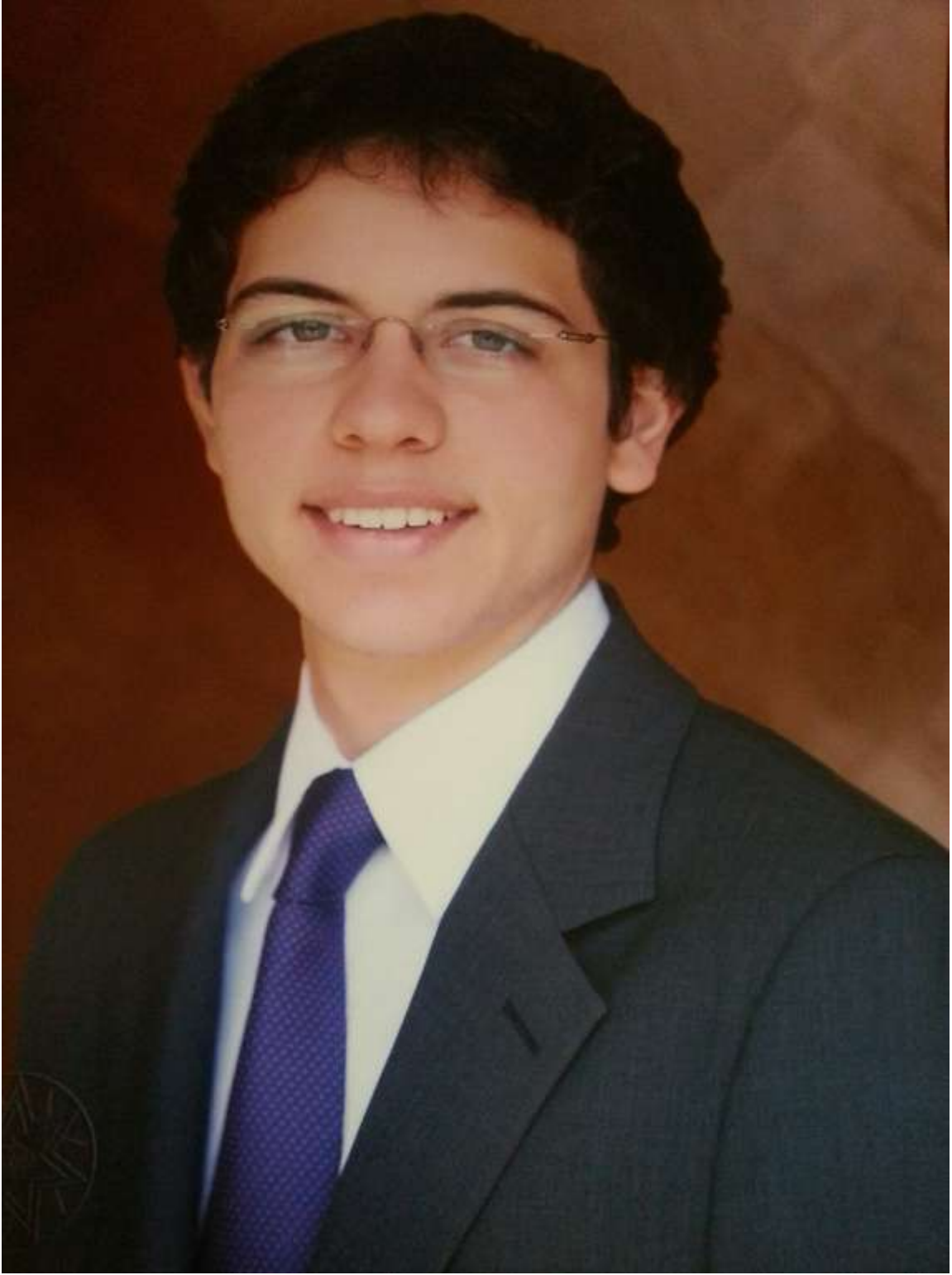
حضرة صاحب السمو الملكي الأمير الحسين ابن عبدالله الثاني ولي العهد المعظم